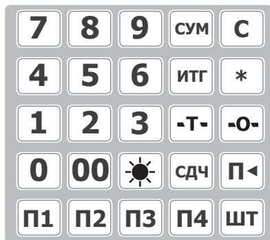
Рис. 3. Клавиатура