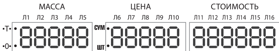
Рис. 2. Индикаторы