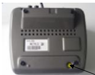
ВМЭН-Х- Z 1 /Z 2 -Д3

Места пломбировки весов от несанкционированного доступа приведены на рисунке 2.