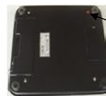
ВМЭН-Х- Z 1 /Z 2 -А ВМЭН-Х- Z 1 /Z 2 -А-3В