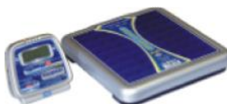
ВМЭН-Х- Z 1 /Z 2 -Д2-А