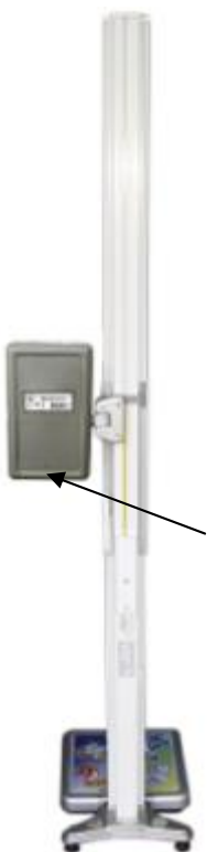
ВМЭН-Х--Z 1 /Z 2 -С-СТ-ПК ВМЭН-Х- Z 1 /Z 2 -С-СТ-А