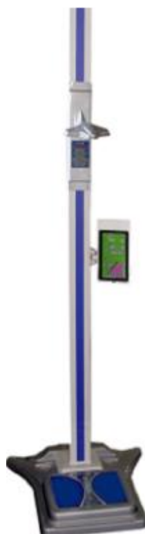
ВМЭН-Х- Z 1 /Z 2 -С-СТ-ПК