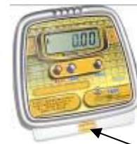
ВМЭН-Х- Z 1 /Z 2 -Д2-А