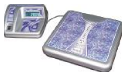
ВМЭН- Z 1 /Z 2 -Х-Д3