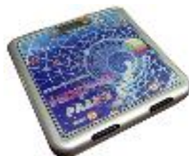
ВМЭН-Х- Z 1 /Z 2 -А-3В