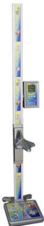
ВМЭН-Х- Z 1 /Z 2 -С-СТ-А