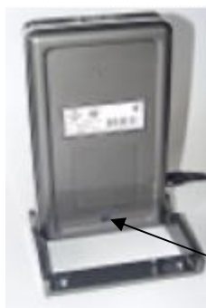
ВМЭН-Х- Z 1 /Z 2 -Д1-А