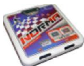
ВМЭН-Х- Z 1 /Z 2 -А