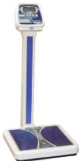
ВМЭН-Х- Z 1 /Z 2 -СТ-А