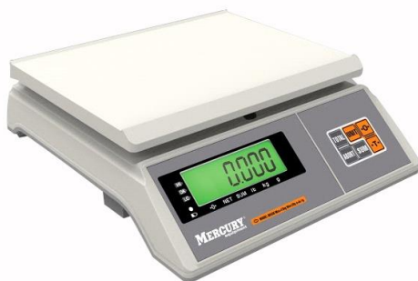
M-ER [X2Z][F]-[Max][d] M-ER [X2Z][L]-[Max][d]

Схема пломбировки от несанкционированного доступа, обозначение места нанесения знака поверки представлены на рисунке 3.