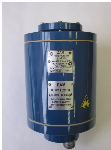
Рисунок 3. Внешний вид газоанализаторов исполнения ИБЯЛ.407111.002-15,-16,-22...-24 с диффузионным способом отбора пробы