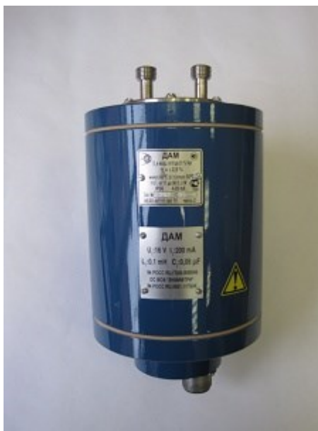
Рисунок 2. Внешний вид газоанализаторов с принудительным способом отбора пробы исполнения ИБЯЛ.407111.002-02...-49