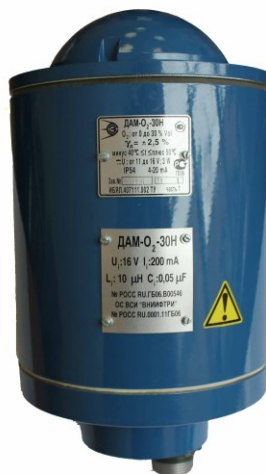
Рисунок 1. Внешний вид газоанализаторов ИБЯЛ.407111.002,-01 с диффузионным способом отбора пробы

Схема пломбировки от несанкционированного доступа и обозначение мест для нанесения оттисков клейм приведена на рисунке 4.