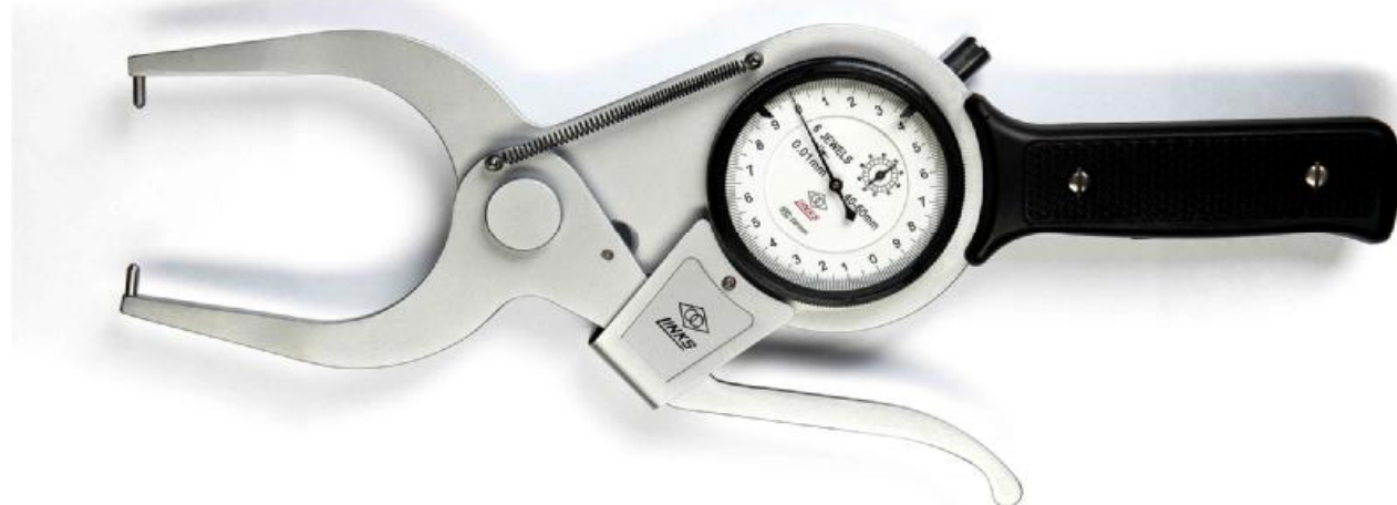
Рисунок 1 - Общий вид кронциркулей индикаторных серии 824

Пломбирование корпуса кронциркулей не предусмотрено.