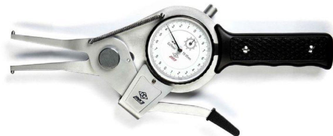
Рисунок 2 - Общий вид кронциркулей индикаторных серии 825