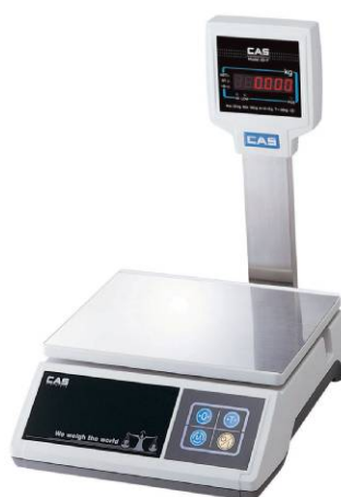
SW (модификация со стойкой)