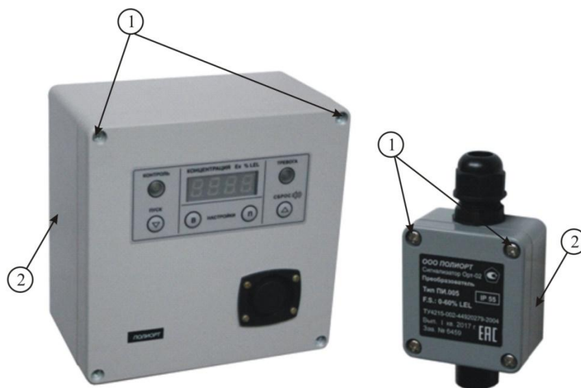
Рисунок 1 - Общий вид сигнализатора общепромышленного исполнения «Орт-02»